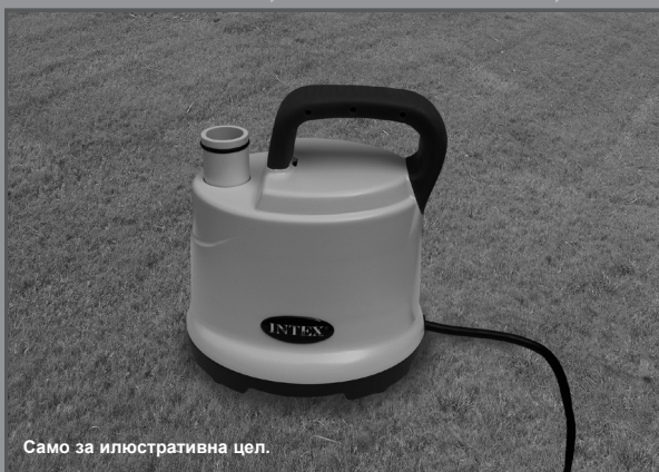
Само за илюстративна цел.

Не забравяйте да изпробвате и другите чудесни продукти на Intex: басейни, аксесоари за басейни, надуваеми басейни и играчки за дома, въздушни матраци и лодки; те се предлагат в магазинната мрежа, както и на нашия уебсайт.